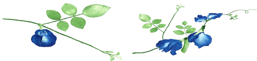
ภาพที่ 1 ผลงานการวาดดอกอัญชันของผู้เรียน